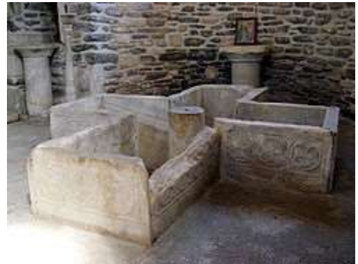
Doopbassin uit de Oudheid

Zes bijeenkomsten per jaar op donderdagavond in De Wingerd in Linschoten; Informatieve inleidingen, beeldmateriaal, bespreking van korte teksten uit de kerk der eeuwen;