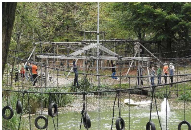
Groetjes van de tienerkamp leiding

Mocht je nog vragen hebben, dan kan je ons bereiken via bovenstaande telefoonnummers.