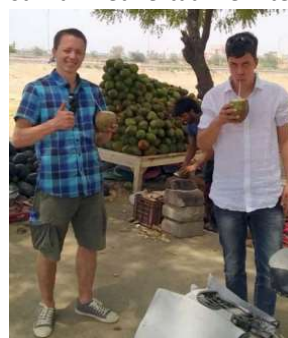
Bezoek uit NL: even een kokosnoot leegdrinken