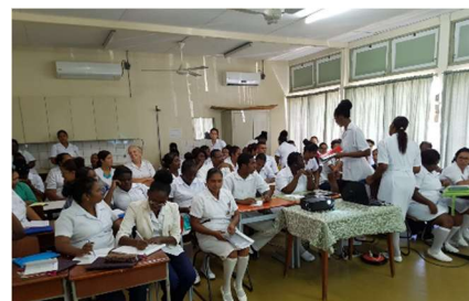
Klaar voor klinische les stomazorg

Trieste verhalen die het belang aangeven van scholing op psychosociale en praktische aspecten van stomazorg. Daar gaat de nieuwe opleiding voor stomaverpleegkundigen zeker aan bijdragen. Naast de scholing gaat SNF ook bijdragen aan het opzetten van een patiëntenvereniging stomazorg in Suriname. Stomapatiënten kunnen elkaar daarin ontmoeten en zich gezamenlijk sterk maken voor beter leven met een stoma in Suriname.