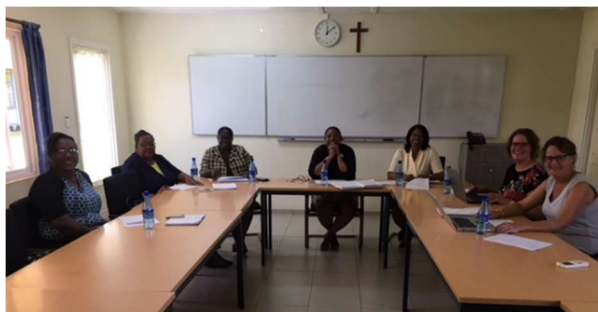
Projectgroep StomaSU in vergadering.

Het bestuur van SNF is erg blij met de toezegging van de Nazomermarktcommissie om een deel van de opbrengst te bestemmen voor SNF. Daarvoor zullen oefenmaterialen aangeschaft worden om de praktijklessen te kunnen verzorgen. Op de Nazomermarkt zullen wij ook aanwezig zijn en willen u graag verder informeren over het werk. SNF bedankt bij deze de Nazomermarktcommissie bij voorbaat hartelijk voor haar inspanningen en wenst haar veel succes bij alle voorbereidingen.